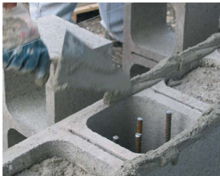
Realizzazione di un muro in blocchi di cls con MALTABLOC. Particolarmente indicata anche per il riempimento dei blocchi-pilastrini in cls.