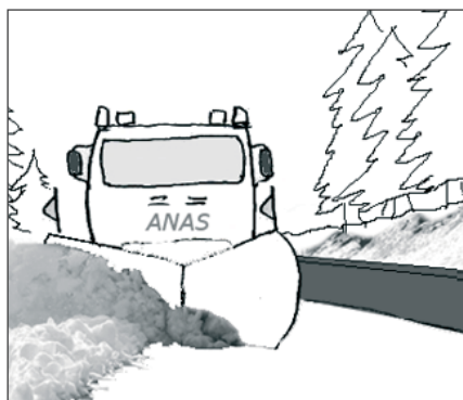
CLS in zone di gelo/disgelo e uso di sali disgelanti: muretti di recinzione, muri di sostegno, marciapiedi, pavimentazioni esterne ...