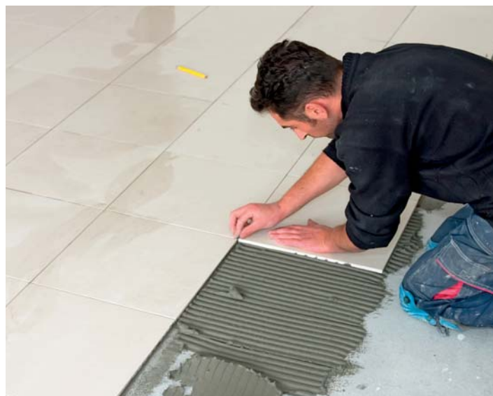
Posa di ceramica di grande formato con LACOLLA