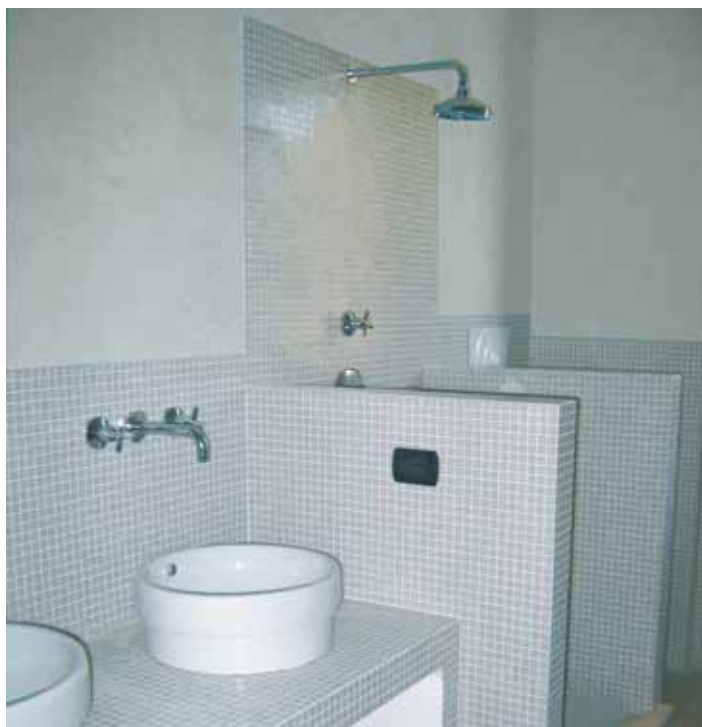
Intonaco di finitura interno realizzato con MALTA FINE.